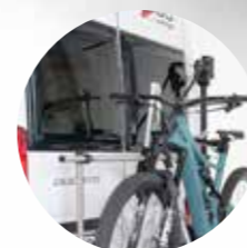
Ausreichend Platz auch für große Bikes