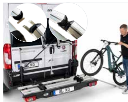
Komfortabel beladen, auch per Rampe