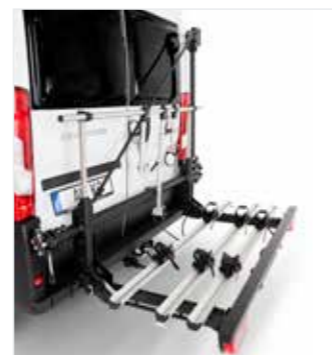
Rüstsatz für 3 E-Bikes oder Fahrräder