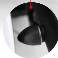
Stabiler Schutz vor Beschädigung der Hecktüren