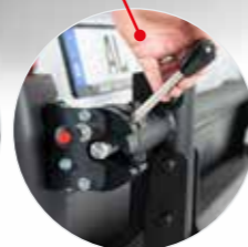
Verriegelung mit optional erhältlichem Schloss sichern