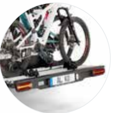
Hochwertige LED-Leuchten mit dynamischem Blinker