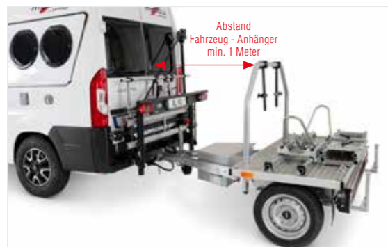
Anhängerkupplung uneingeschränkt nutzbar