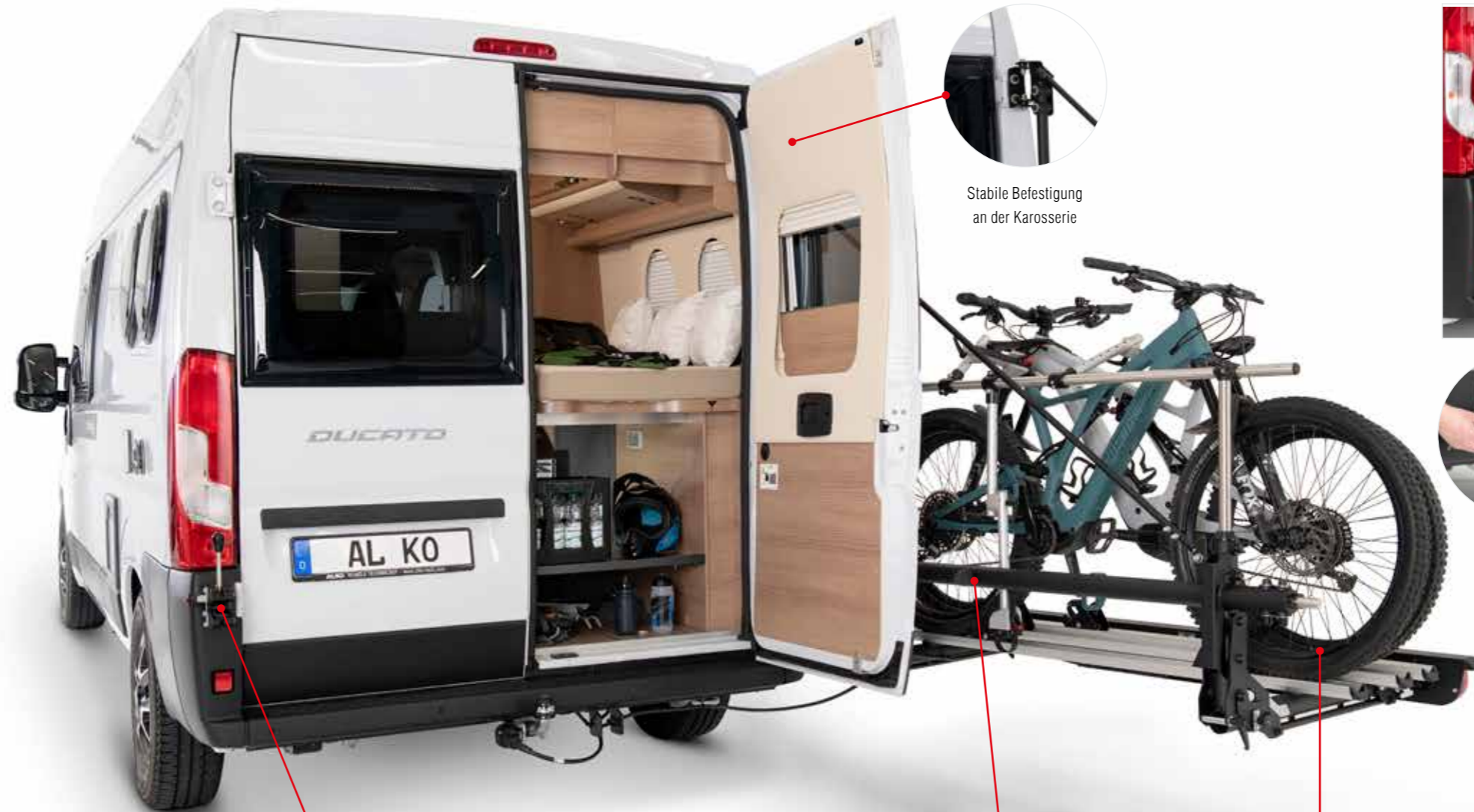
Stabile Befestigung an der Karosserie