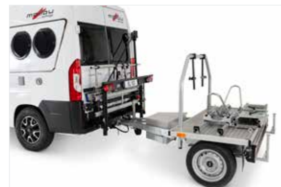
Anhängerkupplung uneingeschränkt nutzbar