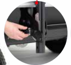
Sichern per unkomplizierter Arretierung