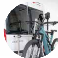
Ausreichend Platz auch für große Bikes