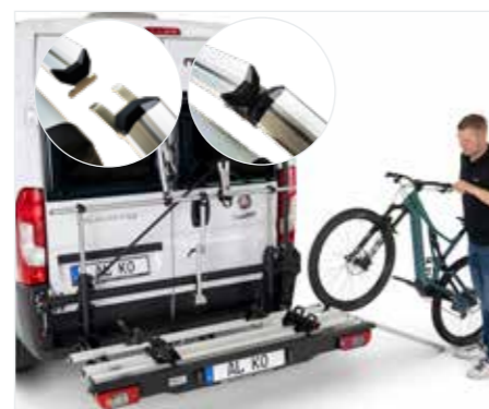
Komfortabel beladen, auch per Rampe