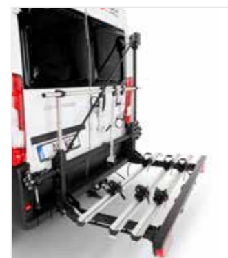
Rüstsatz für 3 E-Bikes oder Fahrräder