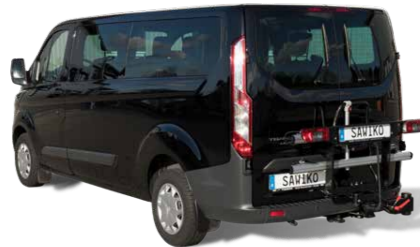
Transportbrücke mit Klappfunktion