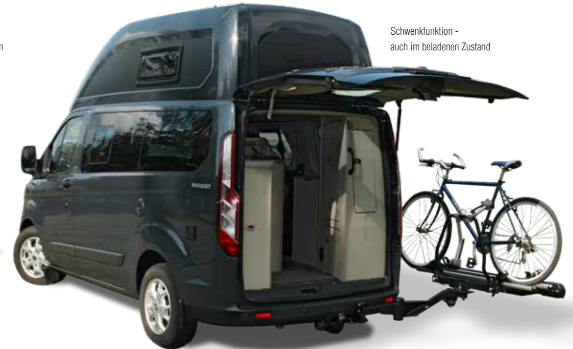
Schwenkfunktion - auch im beladenen Zustand