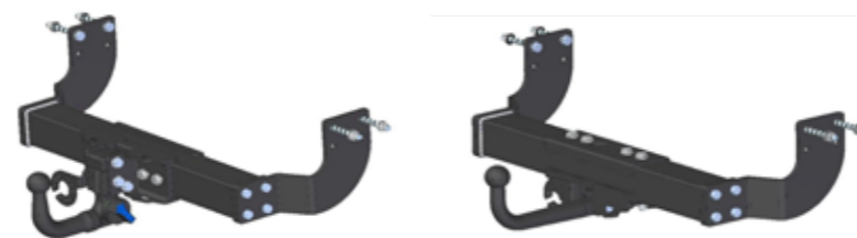
AHK 054 abnehmbar