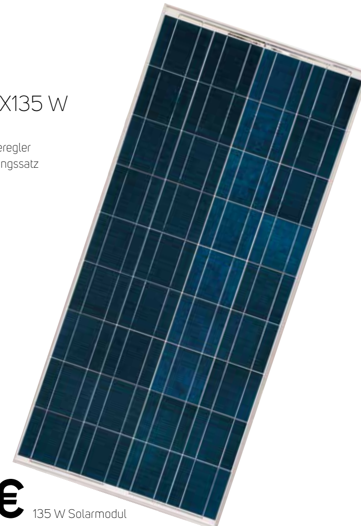
135 W Solarmodul