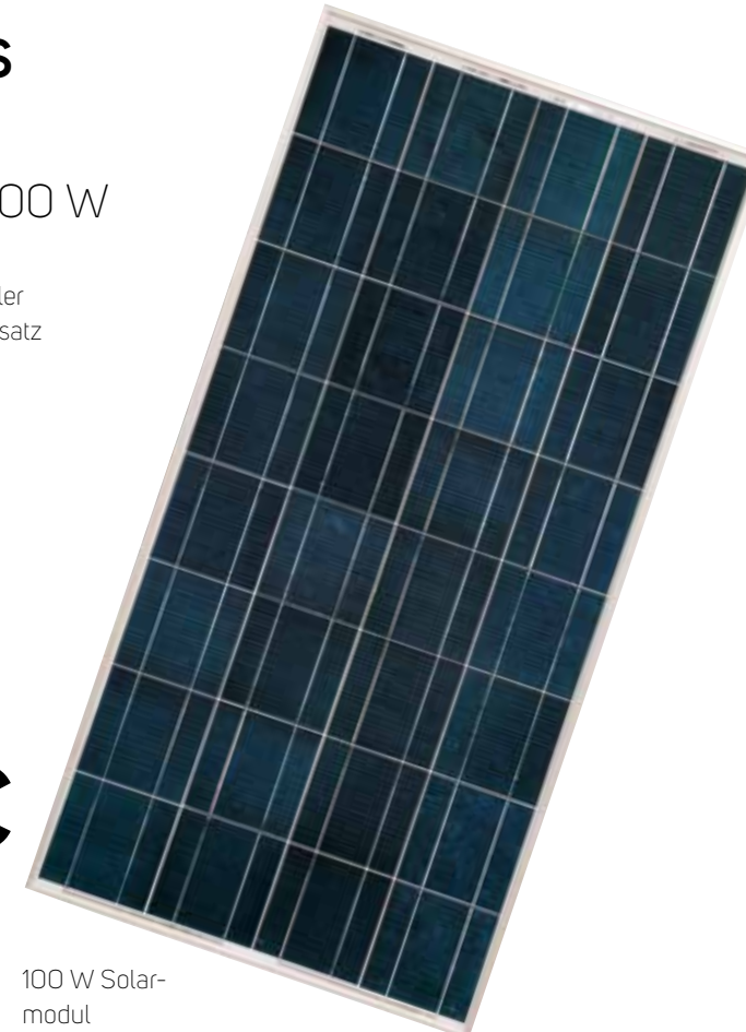
100 W Solar- modul