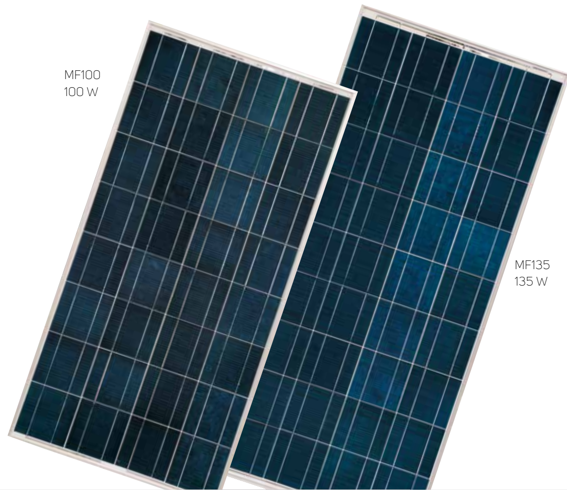
MF100 100 W

te und verhindert dadurch eine Oxidation. Die Rahmen der Module bestehen aus eloxiertem Aluminium und die Anschlussdose auf der Rückseite des Moduls enthält die By-Pass Dioden, sowie die Anschlüsse für den weiterführenden Kabelbaum. CBE-Photovoltaikmodule werden unter Verwendung höchster Standards und hoch entwickelter Technologien hergestellt und entsprechen den gültigen EU-Normen. Ihre ausgewiesene Leistung wird durch eine 25-jährige Garantie abgedeckt.